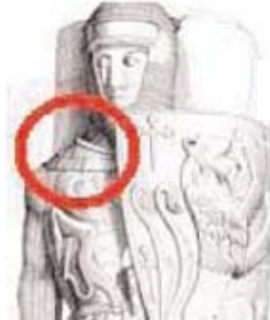
Exemples de colletins